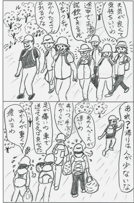
堀内慶一(地区労連議長) 作