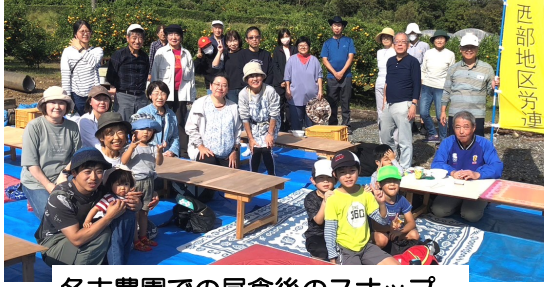
名古屋農園での昼食後のスナップ

11月3日、西部地区労連は恒例のウォーキング&みかん狩りを行い、36名が参加しました。