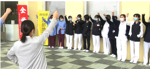
正門前でシュプレヒコールするスト参加者

するとしています。被爆国の日本が「核」の名前を出すことじたいに憤りを覚えます。何よりも軍拡反対の声を上げ続けることが大切です。日本被団協がノーベル平和賞を受賞しました。日本政府は核兵器禁止条約を批准すべきです。27日は選挙です。裏金まみれの自民党政権に終止符を打つべく、投票には皆で誘い合つて行きましょう。地区労連は各労組のパイプ役です。いつでも気軽に立ち寄ってください。地区労連ニュースでは、組合員の皆さんのたわいもないお話を紹介する記事も始めました。投稿をお待ちしています。